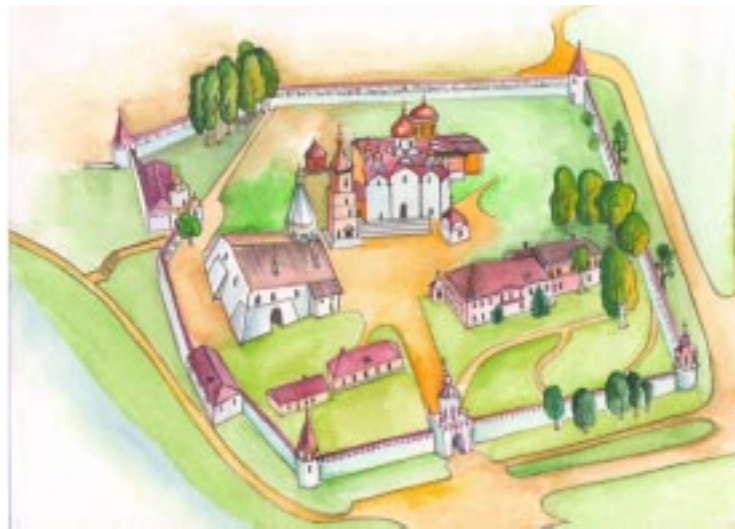
Карта Старицкого Свято-Успенского монастыря. Выполнена студией изобразительного искусства Дома детского творчества

Слышали вы когда-нибудь, как звонят колокола Свято-Успенского монастыря? Это настоящее чудо. А построена монастырская колокольня в шестнадцатом веке князем Андреем Старицким и была сначала деревянной, затем её разобрали и возвели каменную, установили здесь семь колоколов. Говорят, что один из колоколов был голландского происхождения, его привезли после победы русских над шведами под Полтавой. В начале семнадцатого века под колокольню был похоронен первый Патриарх всея Руси -