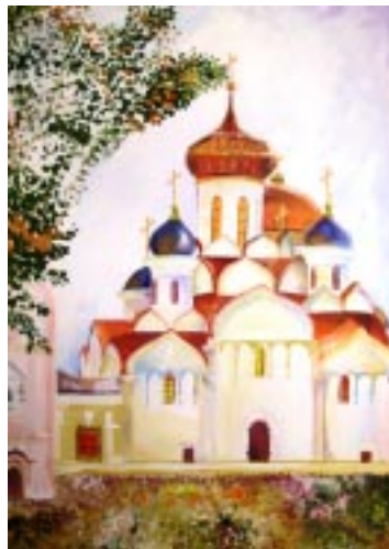
рис. Анастасия Покрашенко

Главным храмом и самой древней постройкой обители является Успенский собор. Он был возведён в 30-е годы шестнадцатого века князем Андреем Ивановичем Старицким. А знаете ли вы, что по виду он похож на Успенский собор Московского Кремля? Он тоже имеет пять глав. Центральная глава символизировала Главу Церкви - Христа, а боковые - четырёх евангелистов. Под храмом устроен трёхметровый подвал. Он хранит тайну.