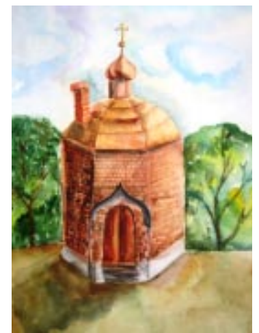
рис. Екатерины Бубновой

Недалеко от Троицкого храма, с северо-западной стороны, стоит небольшая часовня из красного кирпича. Эта часовня построена во имя Святого великомученика Георгия Победоносца. Интересно узнать, что там внутри? Зайдите, и вас поразит великолепием огромный, изумрудного цвета крест и большие глиняные кружки. Это Водосвятная часовня. Каждый желающий может испить здесь святой воды и искупаться в Святом источнике даже в самые сильные морозы, не боясь простудиться. Вода очищает душу и тело, а лики Святых глядят со стен часовни и как бы благословляют на добрые дела.