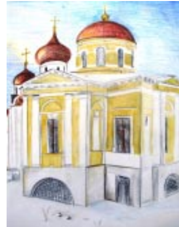
рис. Эльвиры Кочетовой