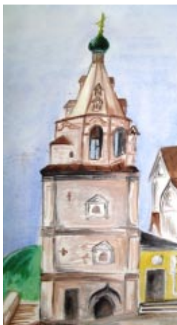
рис. Дианы Шуваловой