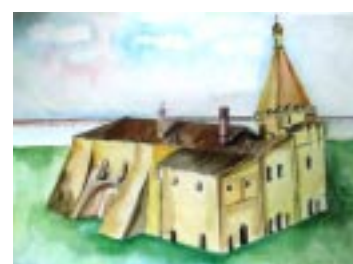
рис. Елизаветы Коротковой

Не обошли этот храм и события Великой Отечественной войны. Известно, что зимой